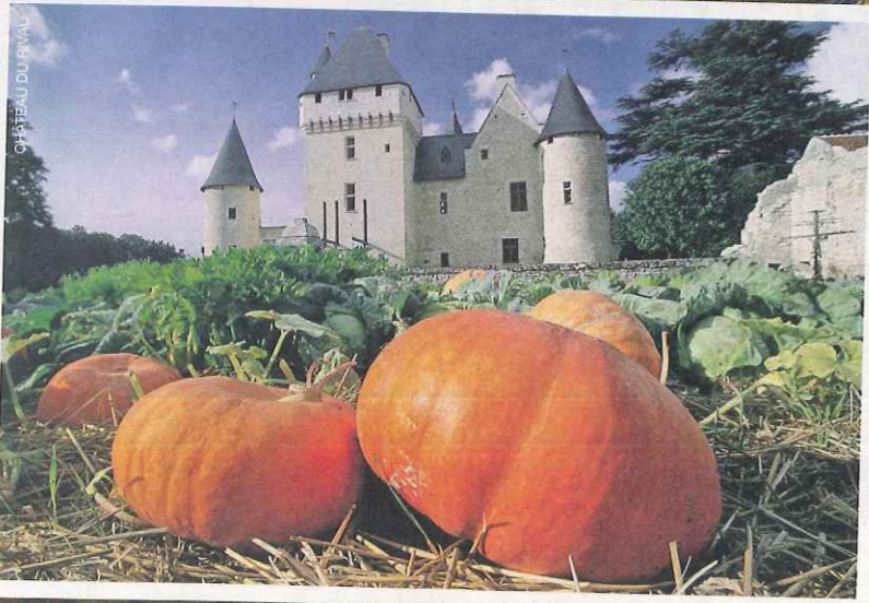
CHATEAU DU RIVAU